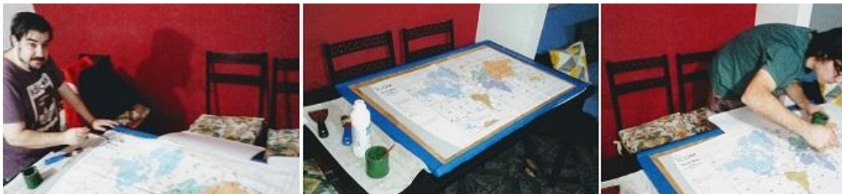
Fotografías 19: Preparando para enmarcar el mapa de zonas CQ, para el shack de radio