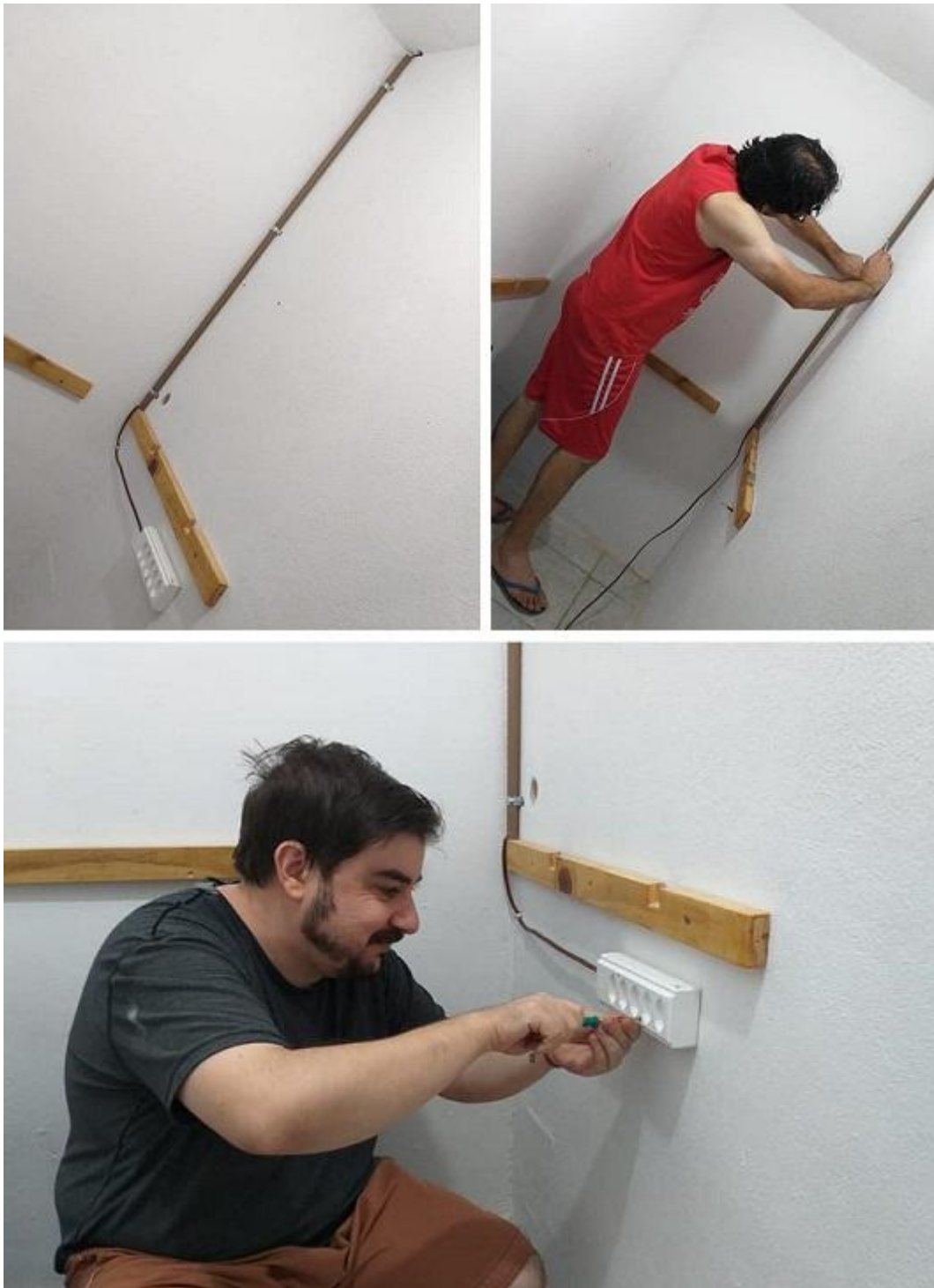
Fotografías 9: Los chicos preparando la energía eléctrica del shack de radio