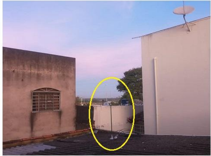
Fotografías 30: la segunda antena instalada fue la Antena de base Vhf 1/4 de Onda, en la parte trasera del techo de la casa