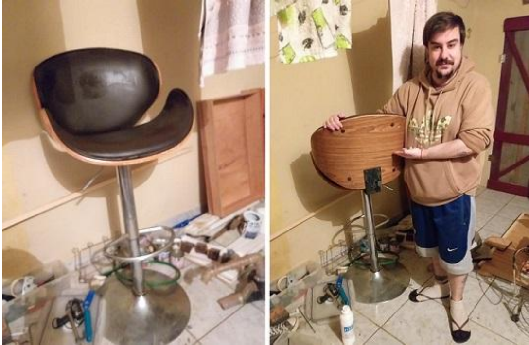
Fotografía 26: Silla de bar, encontrada en la calle, solo estaba quebrada su base de metal, la cual soldamos y modificamos a la altura de la mesa del shack de radio