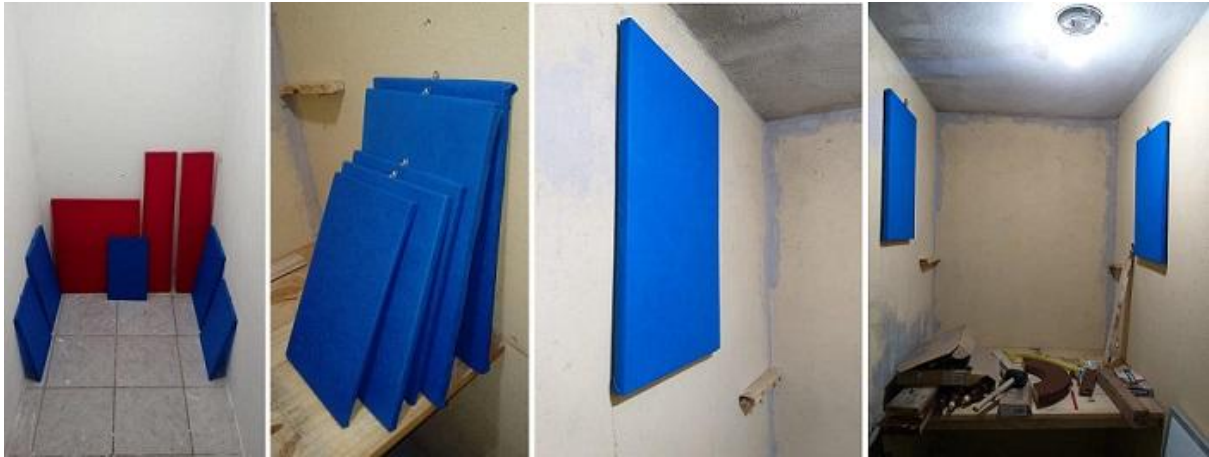
Fotografías 13: Presentación de los paneles en color rojo y azul

El rojo simboliza la sangre, el fuego, el calor, la revolución, la pasión, la acción y la fuerza. Tiene un temperamento vital, ambicioso y material, y se deja llevar por el impulso, más que por la reflexión.