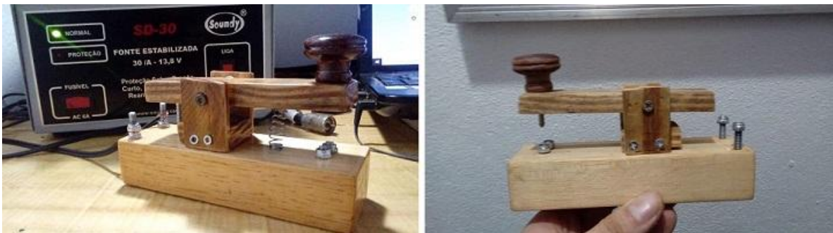
Fotografías 22: Proyecto de Mark (LU3DU), armado de manipulador de CW , (estilo ferroviario inglés)