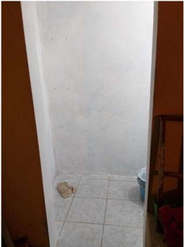
Fotografías 3: Paredes listas