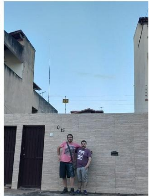
Fotografías 29: la primer antena instalada fue la antena vertical Antron 99, bada de 10 Mts y 11 Metros banda ciudadana