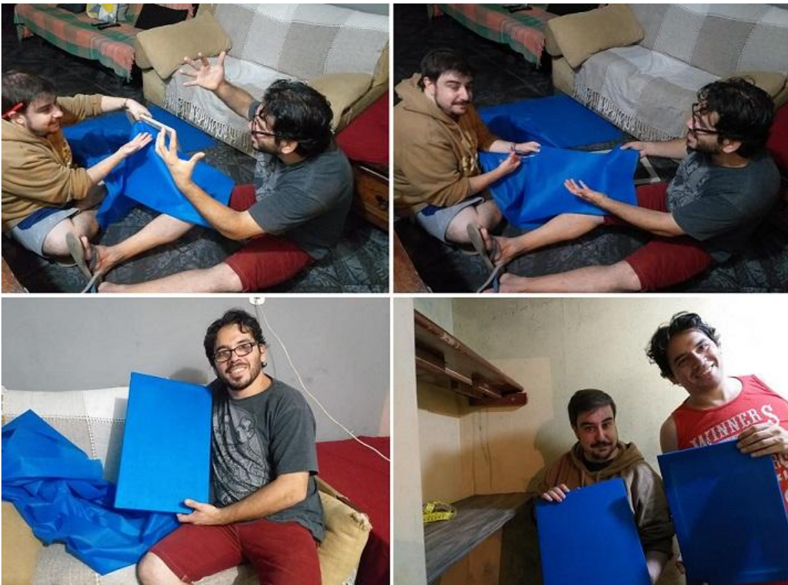
Fotografías 12: Nos divertimos armando paneles para acustizar el cuarto, el shack de radio al ser tan pequeño rebota mucho la voz, gracias a estos paneles, el sonido del cuarto quedo perfecto