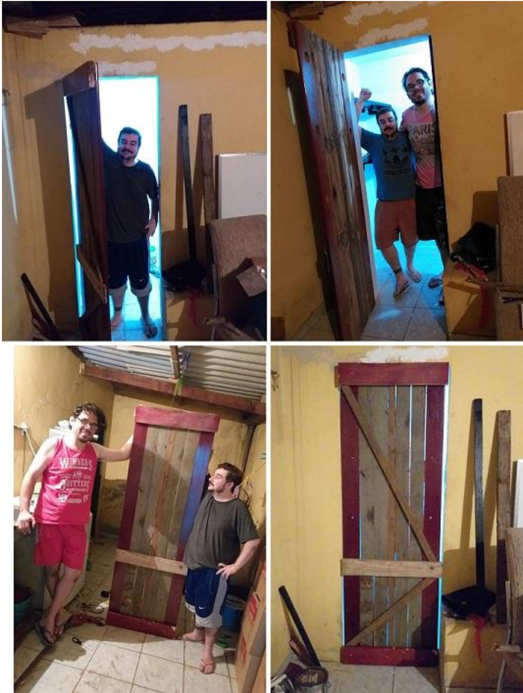
Fotografías 11: la puerta del shack de radio esta lista

Mientras armamos el shack de radio, tuvimos muchas buenas conversaciones y sacamos muchas conclusiones y reflexiones sobre nuestra pasión.