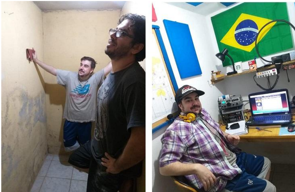
Fotografía 1: El antes y el despues, construcción del Shack de Radio

El trabajo y la rutina diaria hacen que no dispongamos del tiempo suficiente para armar nuestra estación de radio, más aún cuando hay que empezar de cero.