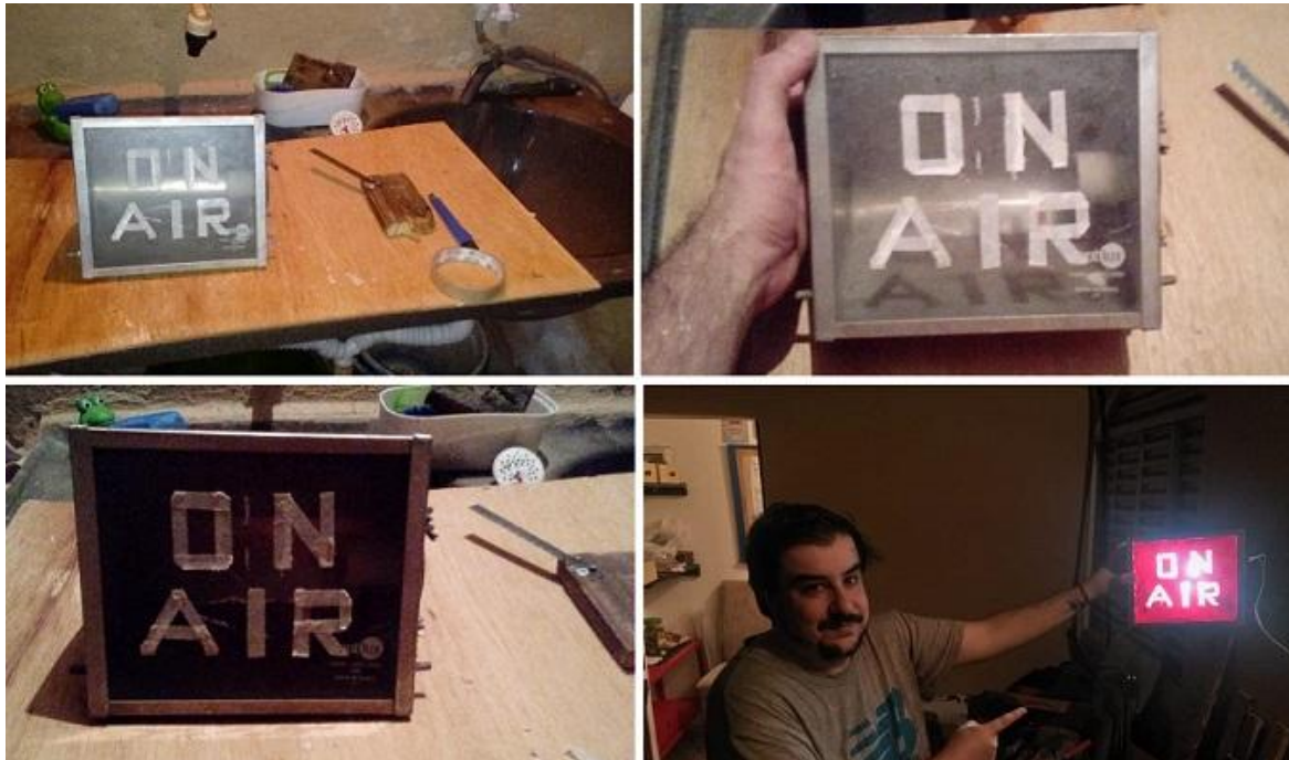
Fotografía 24: Construcción de un cartel “On Air”, con farol encontrado tirado en la calle

En nuestras salidas a la calle, en busca de materiales, nos encontramos un farol, que rápidamente lo convertimos en una luz de aire y como si fuera poco, encontramos una silla de bar, que adaptamos a la altura del shack de radio.