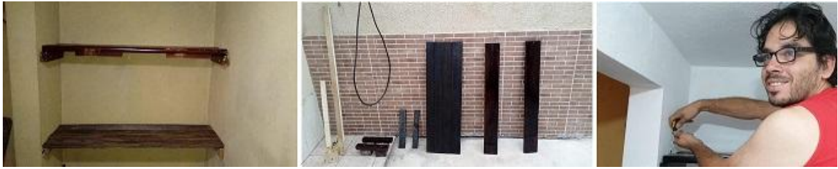
Fotografías 8: Mark colocando los estantes