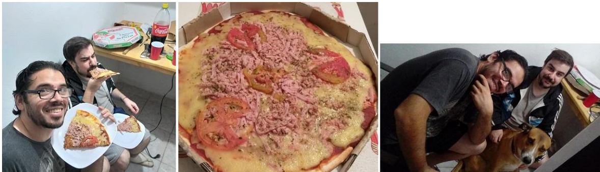
Fotografías 27: Una de las cosas muy importantes, que no mencione, es la cantidad de pizzas que se utilizaron en el armado de la construcción del shack de radio, créanme que fueron muchas pizzas. También quiero agradecer a mi perro "nagui", el cual se encargaba de hacer pis en cada material que traíamos de la calle, para desinfectar a su manera.