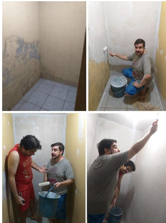
Fotografías 2: Trabajo de limpieza, pintura de las paredes

Decidimos armar el Shack de Radio, en el fondo de la casa, en una vieja despensa o alacena, donde no había, energía eléctrica y realmente estaba muy desmejorado todo.