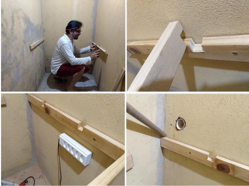
Fotografía 4: Antes de pintar se hicieron mediciones de lo que sería la mesa del Shack de Radio y se hicieron los orificios para pasar los cables coaxiales y la electricidad