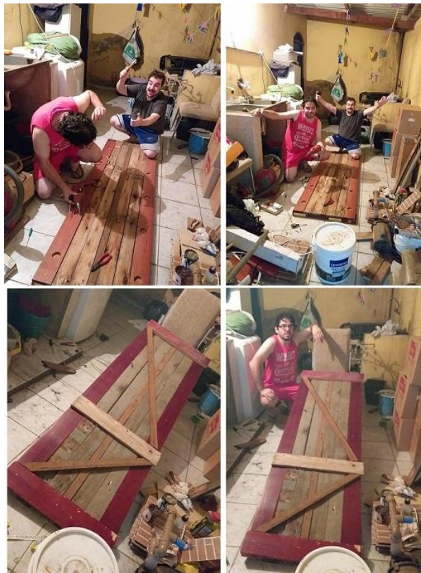
Fotografías 10: Con todas maderas encontradas en la calle y reutilizadas, armamos una puerta para el shack de radio, estilo granjera o de campo