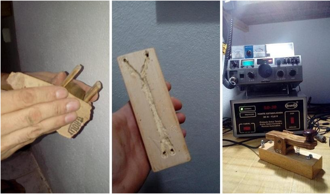
Fotografías 21: Proyecto de Mark (LU3DU), armado de manipulador de CW , (estilo ferroviario inglés)