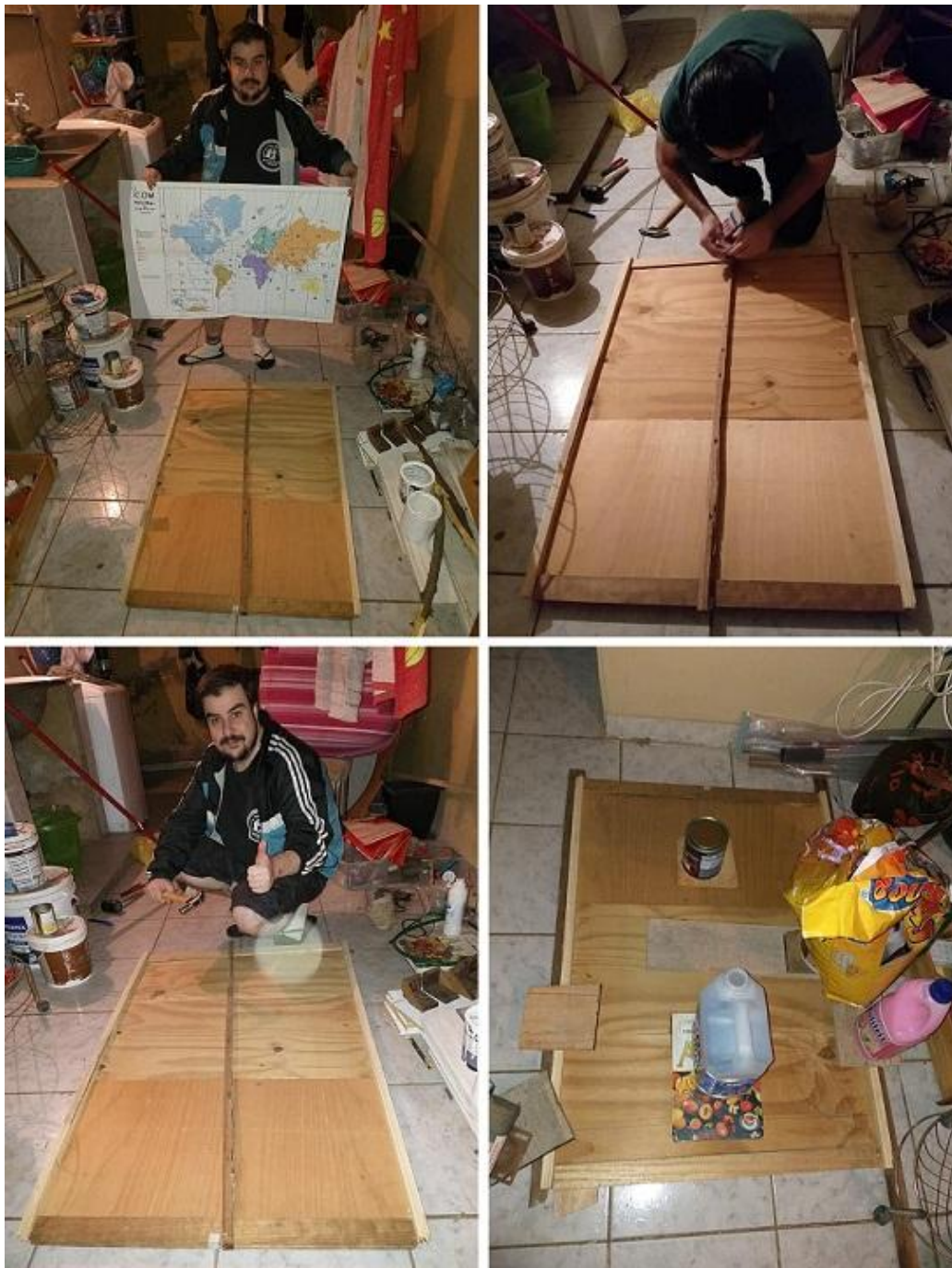
Fotografías 17: Preparando para enmarcar el mapa de zonas CQ, para el shack de radio

Hoy son más decorativos, pero no menos importantes, los hay de zonas CQ y también de zonas ITU.