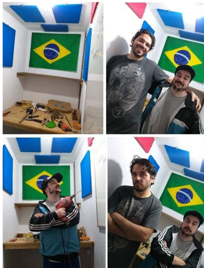
Fotografías 16: La bandera de Brasil, en el shack de radio