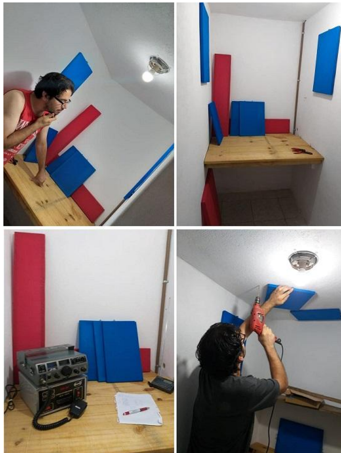
Fotografías 14: mark (LU3DU), colocando los paneles en la pared

El color azul: Es el color de la intelectualidad. Cómo connotaciones positivas evoca la inteligencia, la confianza, la serenidad, la eficiencia, la lógica, la reflexión y la calma.