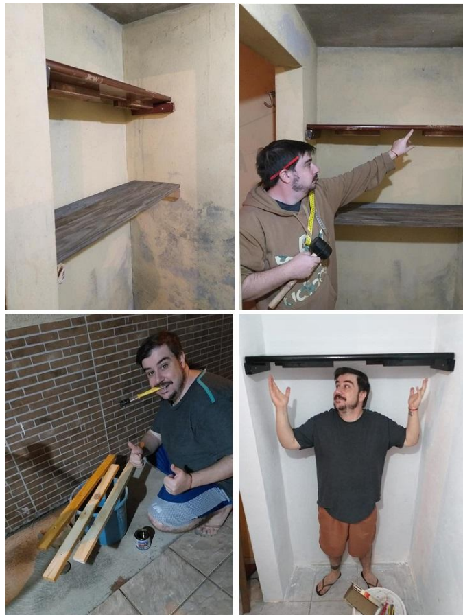
Fotografías 7: Se colocaron diferentes estantes en las paredes traseras, toda de madera reciclada