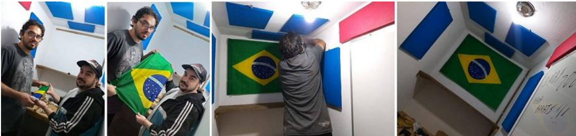
Fotografías 15: Haciendo los honores y colocando la bandera de Brasil en el shack de radio

Sin tener nada que ver con connotaciones ideológicas o políticas, como Argentino y mi esposa por ser Brasileña y ser este el país que elegimos para construir nuestro amor día a día, creo que respetar los símbolos más grande que tiene el país como su bandera es algo muy bueno, por eso decidí colocar la bandera de Brasil en mi shack de radio y usar mi indicativo brasilero "PT2ZDX", con mucho respeto y amor a la buena radio.