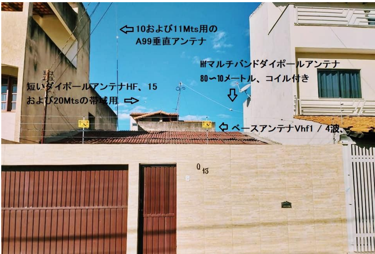
Fotografías 33: Todas las antenas listas para usar