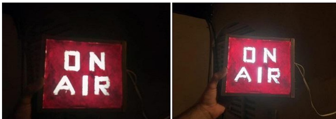
Fotografía 25: Construcción de un cartel “On Air”, con farol encontrado tirado en la calle