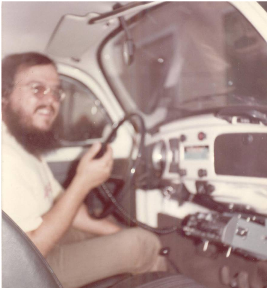
Fotografía 34: orlando PT2OP, en la década del 70, utilizando el Yaesu FT7B como equipo móvil

Por último a mi amada esposa, quien autorizó colocar todas las antenas en el techo de la casa, sin su permiso no estaría escribiendo esto ahora.