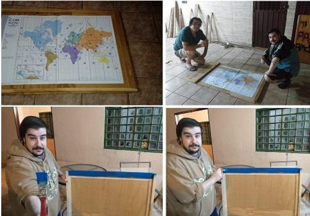
Fotografías 18: Preparando para enmarcar el mapa de zonas CQ, para el shack de radio