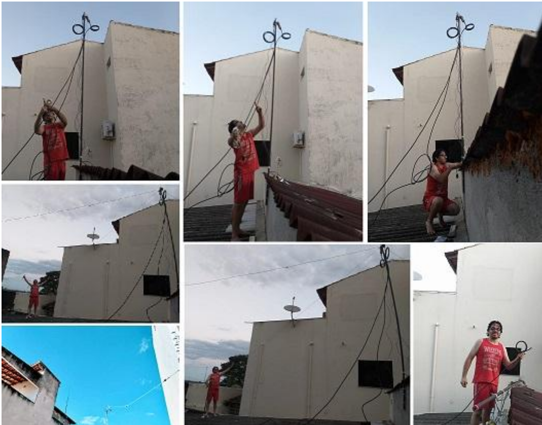
Fotografías 31: las terceras y últimas antenas fueron, los 2 dipolos para HF